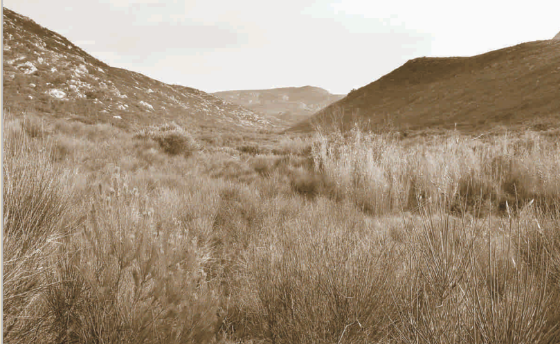
▲ La vall petita des de l'entrada