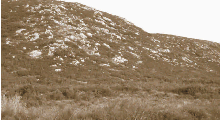
▲ La Mala Terra