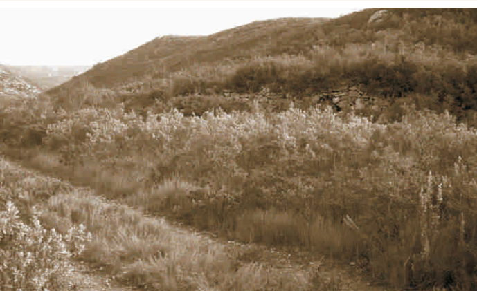
▲ Camí antic amb marge de pedra seca al costat de l'actual