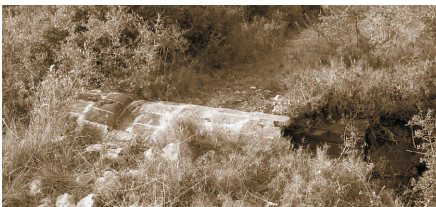
▲ Pont de rajol al camí antic de Bellcaire

per substituir l'extrema frondositat que hi havia en aquest lloc abans de l'incendi i que feia impracticable el pas de les persones. Potser aquesta fou la causa que en aquest lloc hi hagués hagut un canyet o lloc on es deixaven els animals morts que en poc temps desapareixien a causa dels depredadors que hi havia.