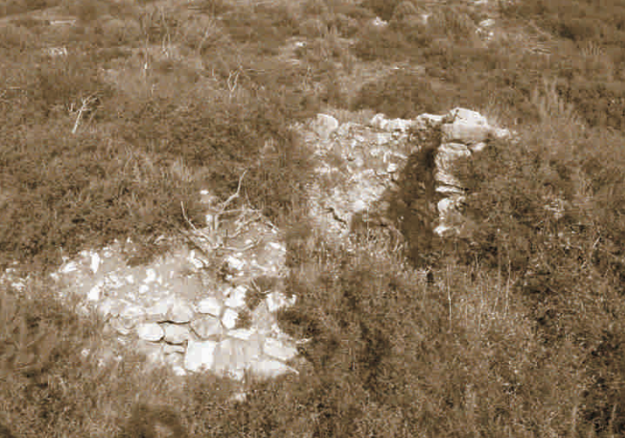
▲ Forn de calç a l'entrada de la Vall Petita