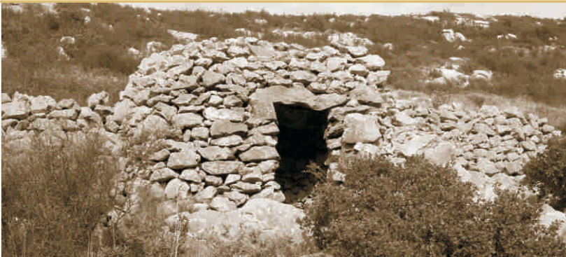
▲ Barraques a l'entrada

La vall de Santa Caterina, amb pendent cap a l'oest i en forma de ferradura, es veu partida longitudinalment del costat de llevant per una petita carena: són les Olletes. Aquests turons marquen la separació entre la Vall Petita, al nord, i l'anomenada Vall Gran, per on passa el camí dels vehicles que van a l'ermita. És al principi d'aquesta línia muntanyosa d'on trenca un camí secundari cap al nord que ens mena a la Vall Petita.